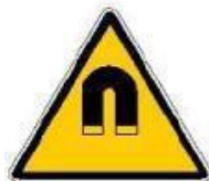
Campo magnetico intenso