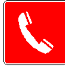
Telefono per interventi antincendio