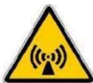
Radiazioni non ionizzanti