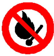
Vietato fumare o usare fiamme libere