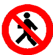
Vietato ai pedoni