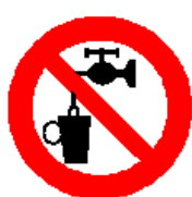
Acqua non potabile