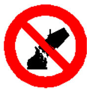
Divieto di spegnere con acqua