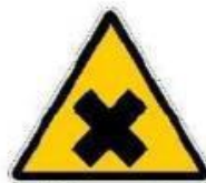
Sostanze nocive o irritanti