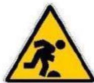
Pericolo di inciampo