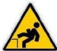
Caduta con dislivello