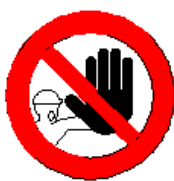
Divieto di accesso alle persone non autorizzate